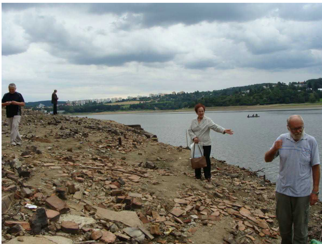
Tady už byly domy Bukovin.