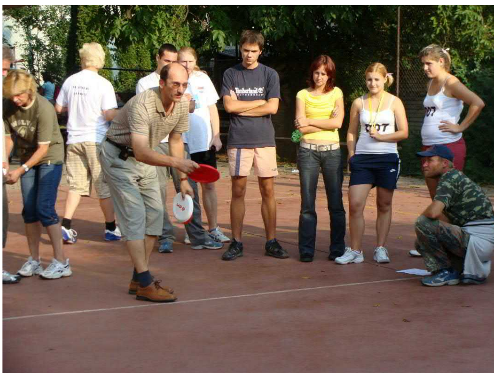
Napínavé byly i závěrečné disciplíny hod talířem a přetahování lanem.