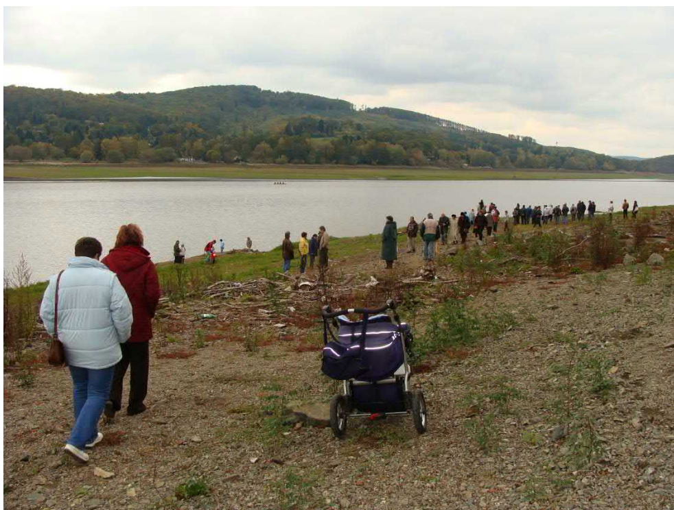
Všichni se rozešli pátrat.