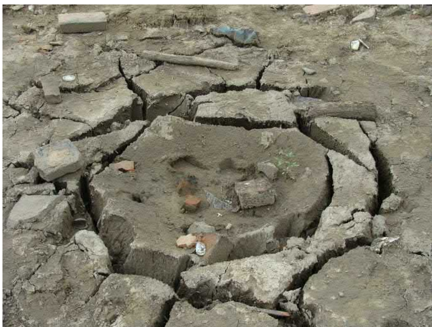
Lze rozeznat bývalou studnu.