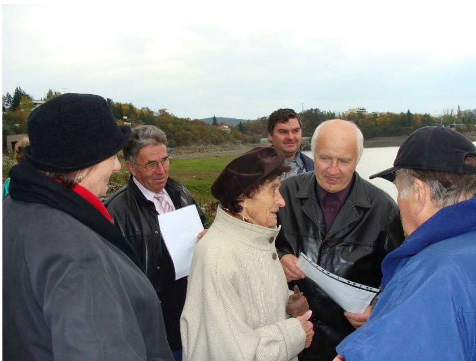
Vzpomínky se vracely i po tolika letech!