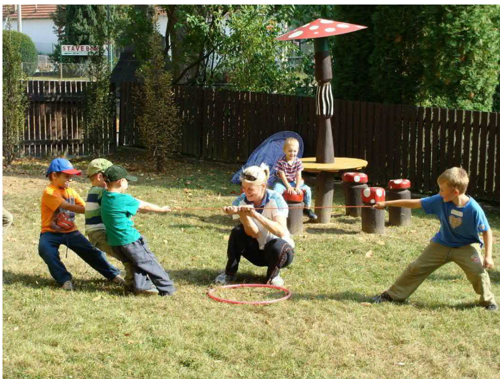
Ti nejmenší se taky snažili, seč jim síly stačily.