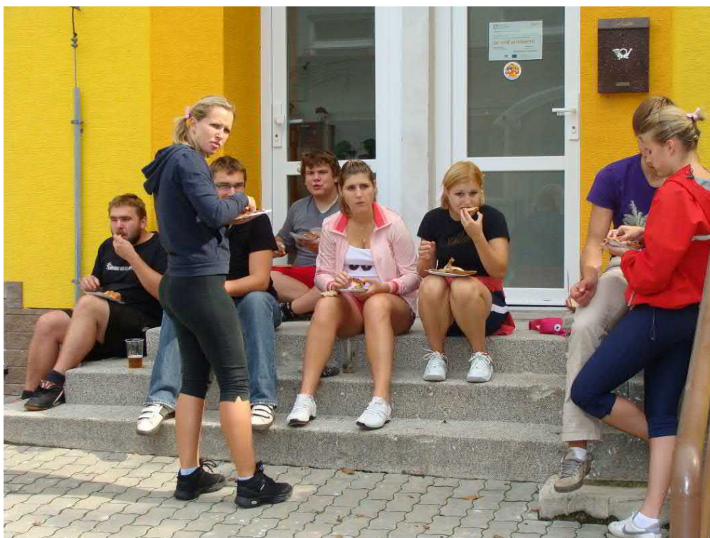
Grilované kuře „šmakovalo“ všem.