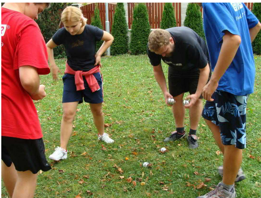
Pétanque je stále oblíbenější a zapojují se do hry celé rodiny.