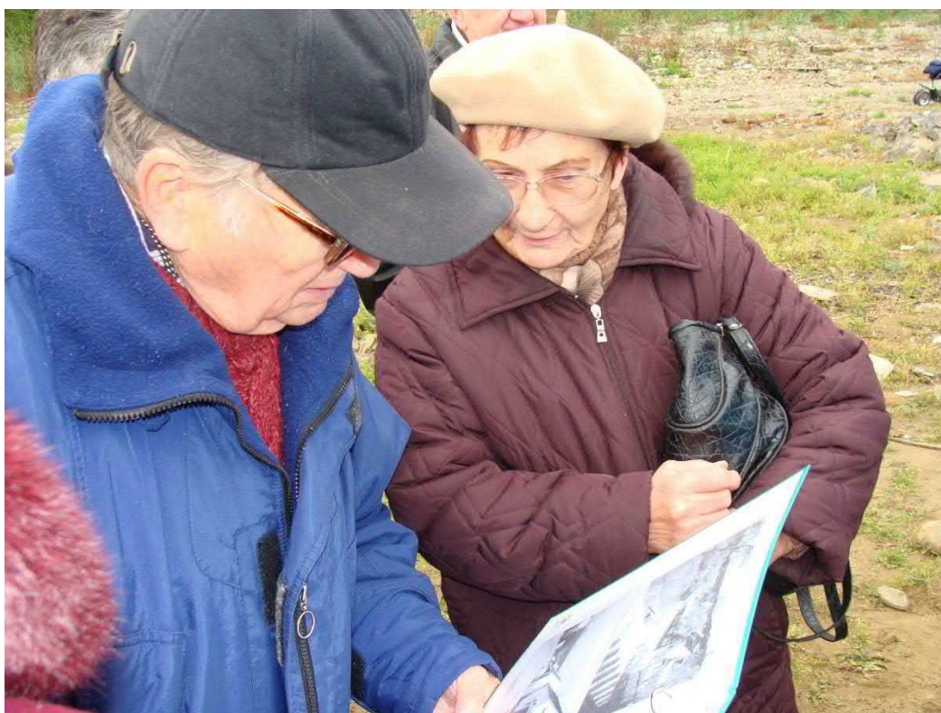
Kde byla obecní studna, se shodli všichni.