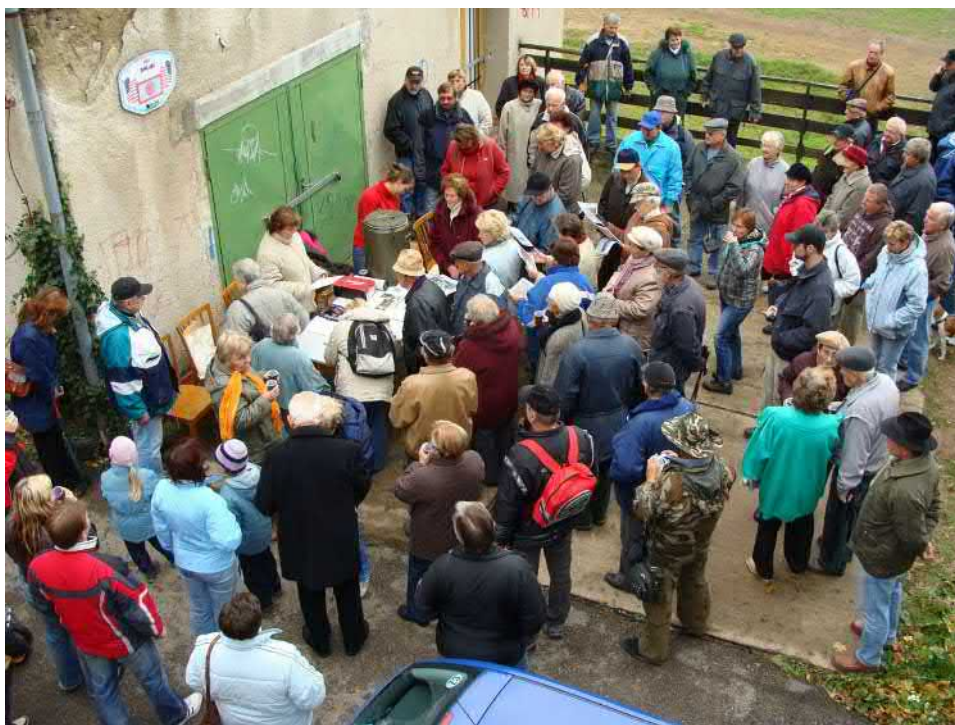
SOPKa přivítala účastníky svařeným vínem.