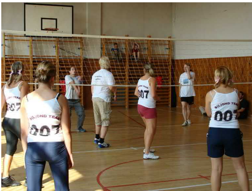
B(L)OND TEAM 007 překvapil svými dresy.