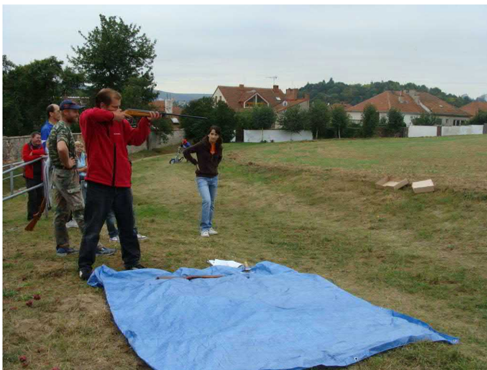
Do střelby vzduchovkou se zapojili nejen muži, ale i děvčata.