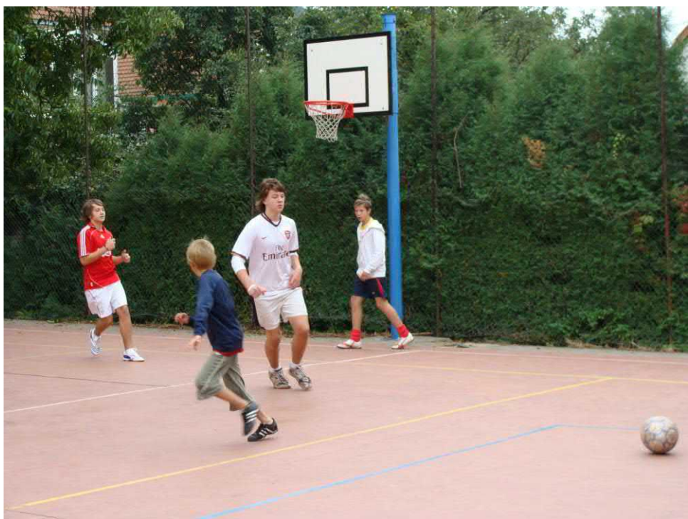
Hráči minikopané bojovali o každý míč.