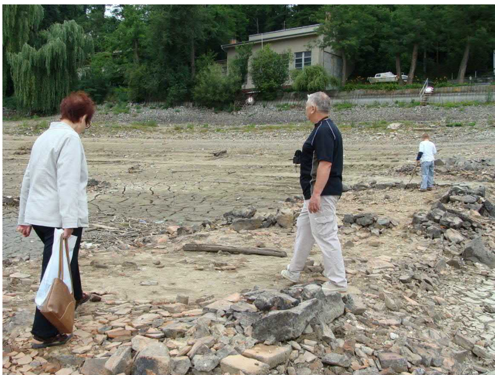
Pamětnice paní Ondrová ukazuje synovi, kde kdo asi bydlel.