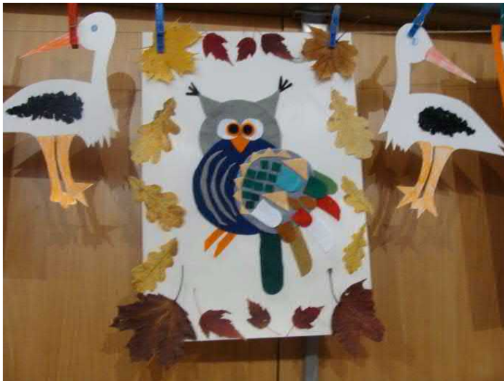
K výzdobě tělocvičny přispěly děti z kníničské mateřské školky.