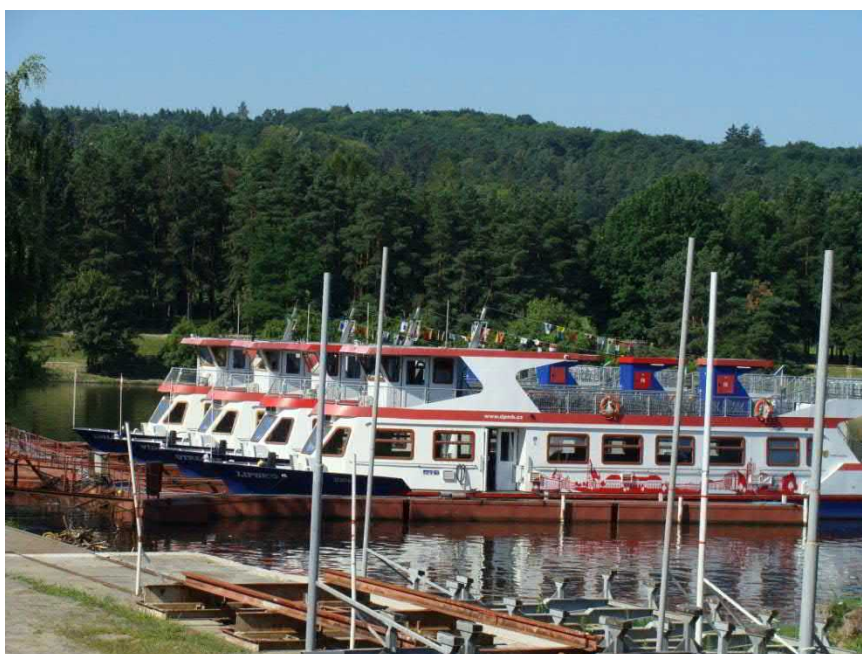
Vyřazená loď Veveří slouží v přístavišti jako restaurace.

Brněnská flotila zahájila svou 65. plavební sezónu. Flotila čítá pět nových lodí z let 2010-2012 Lipsko, Vídeň, Utrecht, Dallas a Stuttgart o kapacitě 200 lidí a historickou loď Brno o kapacitě 120 cestujících. Trasa z Bystrce do Veverské Bitýšky měří 10 km a má celkem 10 zastávek. Vyřazená loď Pionýr skončila v Komárově, Bratislava v Jundrově, Praha na Vranovské přehradě, Veveří v Bystrci.