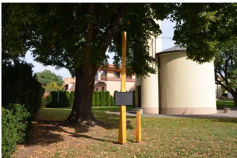
Městská část nechala zhotovit u kapličky pietní místo pro parte zemřelých.