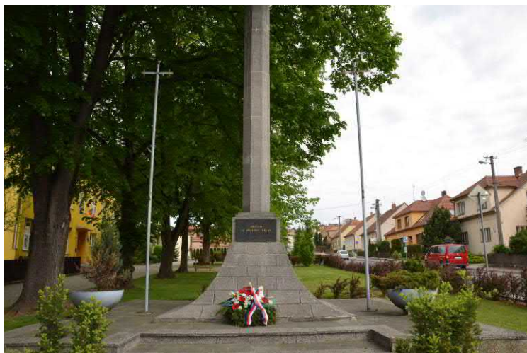
Věnc z živých květů u památníku položený k 70. výročí skončení II. světové války.