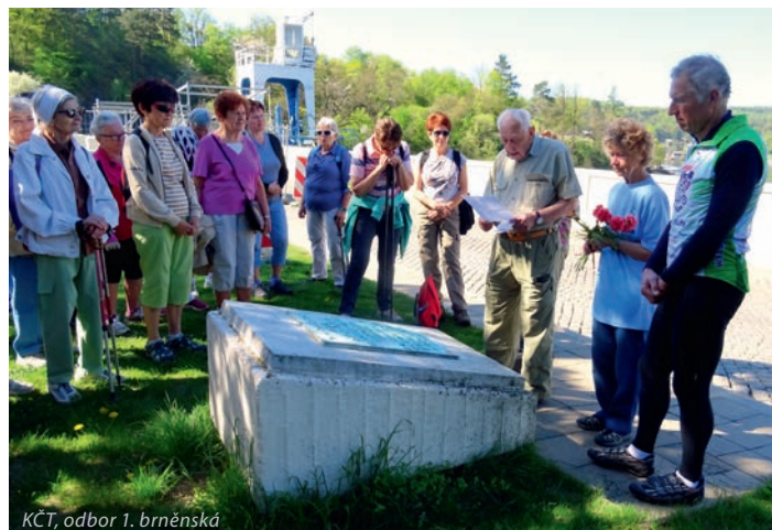
KČT, odbor 1. brněnská

Na přehradní hrázi se již tradičně sešli členové Klubu českých turistů, odbor 1. brněnská. Položili kytici a připomněli si okolnosti záchrany hráze před zničením fašistickými vojsky 26. dubna 1945.