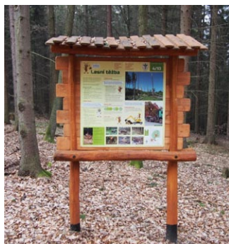
Naučná tabule na Babím lomu