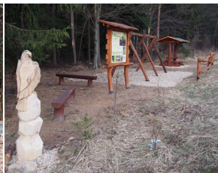
Zastavení naučné stezky