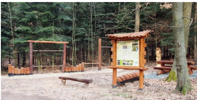
Úvodní zastavení naučné stezky společně s vybavením pro návštěvníky