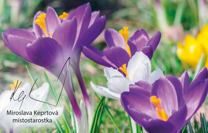
Miroslava Kepřtová místostarostka

Jaro dělá pokusy, vystrkuje krokusy. Dříve, než se vlády chopí, vystrkuje periskopy. Než se jaro osmělí, vystrkuje podběly.