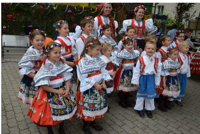
Nezbytné společné fotografie