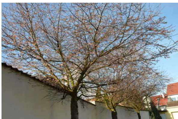
Květy sakury v lednu...

Největší kalamitu způsobila ledovka. Déšť a teplota kolem nuly způsobily, že se vše pokrylo ledem. Prvního prosince stovky domovů zůstalo bez tepla a ve tmě. Zastavila se tramvajová i trolejbusová doprava, problémy způsobily popadané stromy. Policisté řešili v kraji 200 nehod.