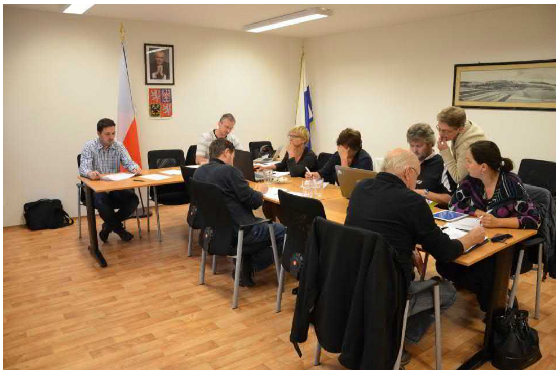
6. října zasedalo naposled odstupující zastupitelstvo Kníniček

Brno bude mít 55 zastupitelů. Vítězné hnutí ANO má 13 křesel, ČSSD 11, Žít Brno 7. KDU-ČSL 7. Propadla pravice. Koaliční smlouvu uzavřeli ANO, Žít Brno, lidovci a Zelení.