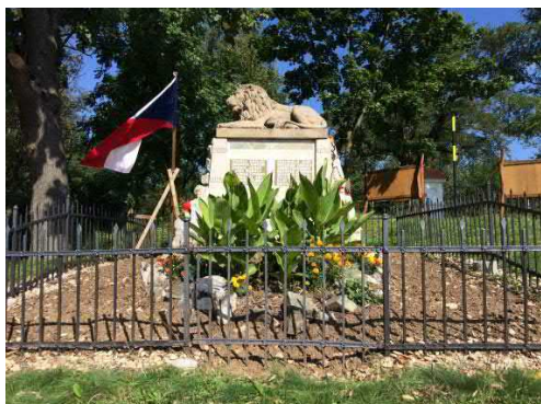
Vysázel květinový záhon u památníku