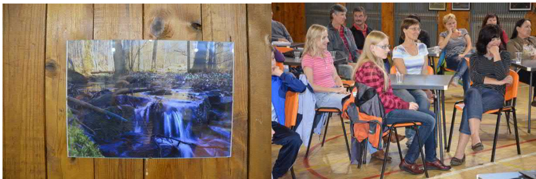
Vítězný snímek a jeho autorka