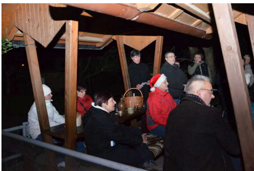
Koledy se zpívaly tradičně přímo na Štědrý den před cukrárnou