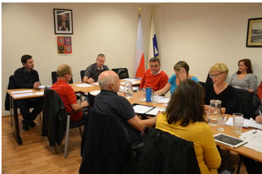
10. října už zasedalo za velkého zájmu hostů nově zvolené zastupitelstvo