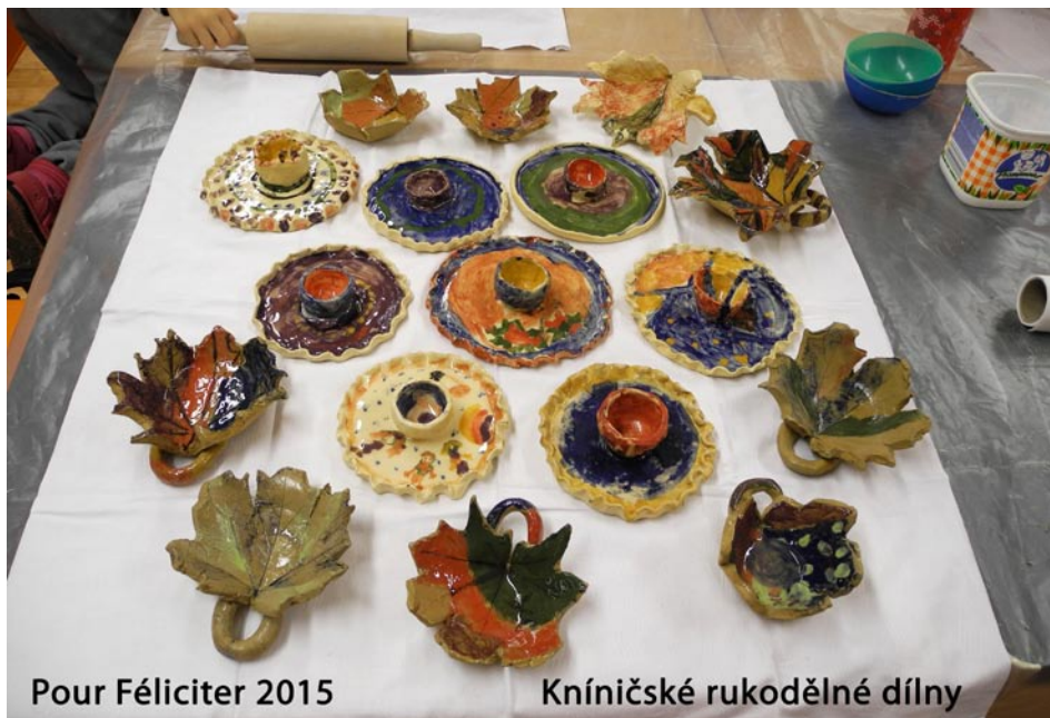
Pour Féliciter 2015